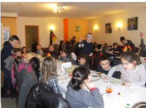
Allemagne : repas typique